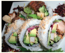
※写真はスパイシーバージョンです。

チキンテリヤキロール ..... 880円 照り焼きチキン、生野菜、胡瓜、マヨネーズ、につめ、天かす、胡麻